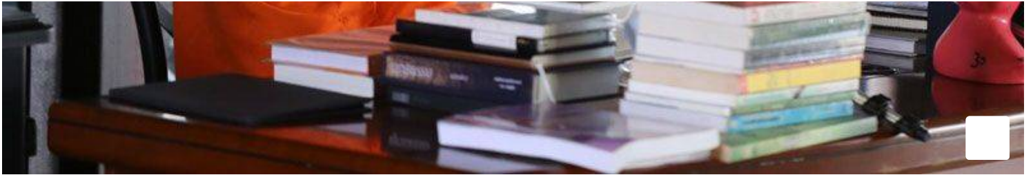
โฆษณา - อ่านบทความต่อต้านล้าง