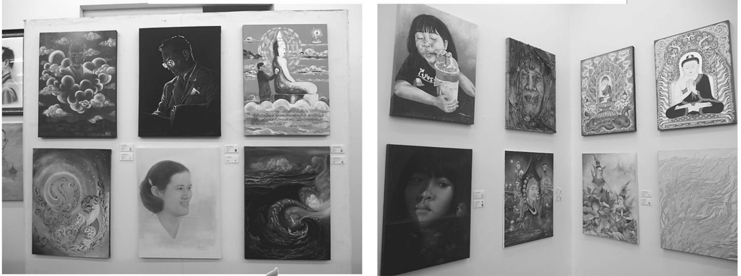
ผลงานศิลปินเซียงราย