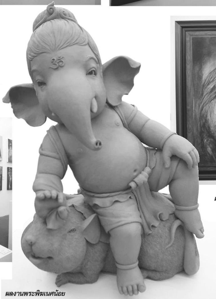
ผลงานพระพิฆเนศน้อย