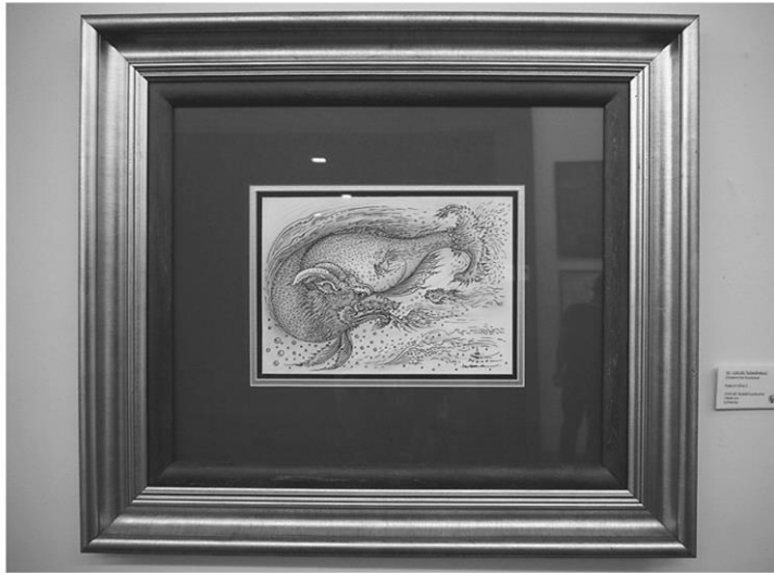
ผลงานของ อ.เฉลิมชัย โฆษิตพิพัฒน์

ที่ 6 ภายใต้คอนเซ็ปต์ “เชียงรายเมืองศิลปะ” และจัดโดยศิลปินสมาคมชีวศิลปะ ที่เปิดกว้างเพื่อให้ศิลปินกว่า 200 คน ได้นำผลงานคนละ 1 ชิ้น ที่แสดงออกถึงตัวตน มุมมองทางสังคม หรือการถ่ายทอดเรื่องราวต่างๆ นำมาจัดแสดงภายในนิทรรศการ ซึ่งผลงานที่นำมาจัดแสดงมีตั้งแต่ศิลปินฝีมือระดับประเทศอย่าง อ.เฉลิมชัย โฆษิตพิพัฒน์ ศิลปินแห่งชาติ ไปจนถึงผู้ที่เพิ่งเริ่มต้นการเป็นศิลปิน โดยงานเปิดให้เข้าชมไปจนถึง 30 มีนาคม 2561 ณ ชิวศิลปะ เชียงราย